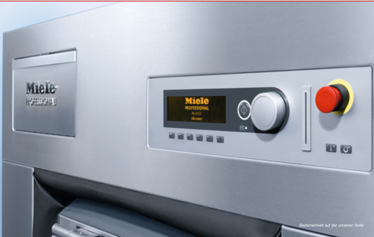
Bedieneinheit auf der unreinen Seite

Die PROFITRONIC M-Steuerung der neuen Waschmaschinen in Trennwandausführung ist eine Innovation aus dem Miele Werk ELECTRONIC und ein weiterer Beweis für die einzigartige Fertigungstiefe bei allen Miele Wäschereimaschinen. Keine zugekauften Standardlösungen, sondern die individuell konzipierte Programm- und Bedieneinheit ist der entscheidende Miele Mehrwert im harten Arbeitsalltag.