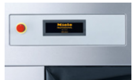
Programmablaufkontrolle am Display auf der reinen Seite (bei der Geräteausführung in Außenverkleidung Edelstahl)

sowie die Auswahl aus 11 verschiedenen Landessprachen. Die Programmwahl erfolgt am Drehwahlschalter. Bedienung und Programmauswahl werden im Display in Klartext und grafischen Symbolen angezeigt. Alternativ kann die Bedienung auch über eine Chipkarte und den Chipkartenleser erfolgen, z. B. zur Freigabe ausgewählter Programme oder zum Übertragen neuer Programme.