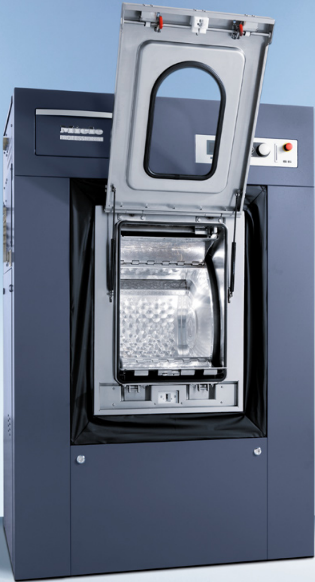
Abb. zeigt PW 6163 in der Ausführung octoblaue