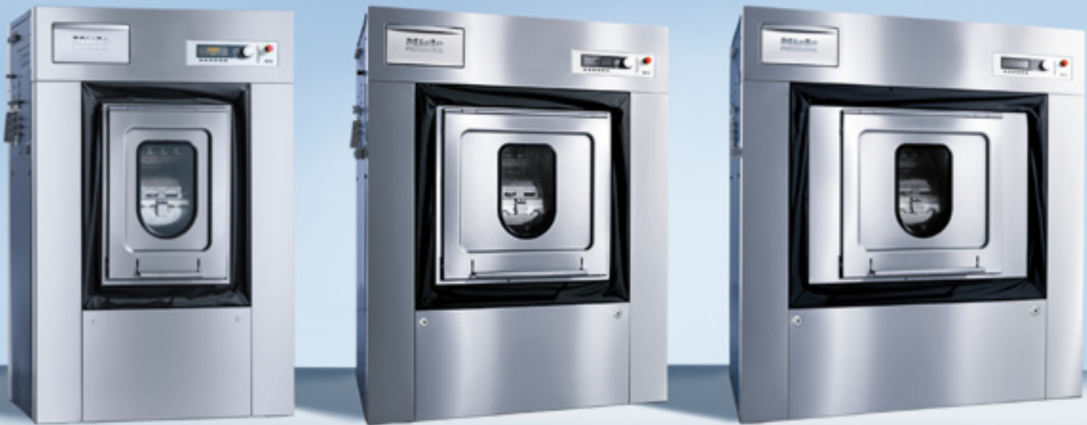
Abb. zeigen die Geräte in der Ausführung Edelstahl